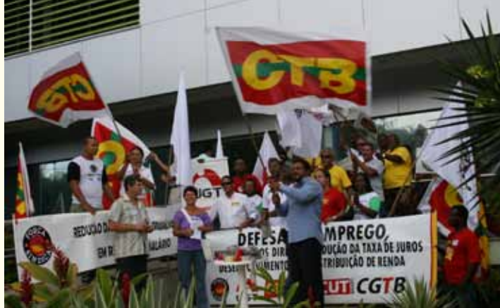
CTB: combatividade nas ruas a favor do cidadão.

a ser mais próxima e daqui para frente a tendência é a de que as centrais tenham maior participação nas decisões fundamentais para o país.