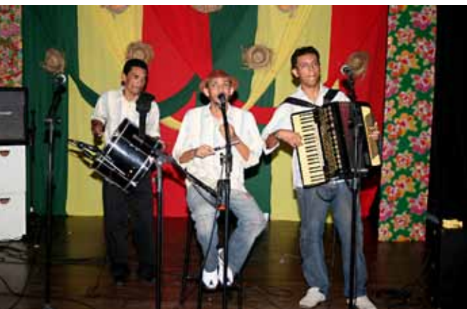
Raul Seixas sempre de portas abertas para a música.

- A literatura desnaturaliza o real e o devolve para nós, recriado. Então, você pode até não se sensibilizar com uma determinada cena degradante vista nas ruas de nossas cidades, mas esta mesma cena, recriada pela literatura, lhe