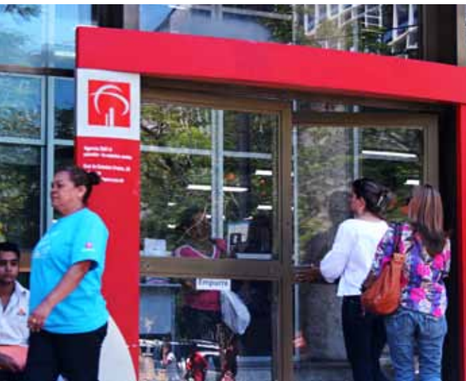
Perigo na saída do banco: o que falta é policiamento.

“pessoas morrem e é como se não tivesse acontecido nada”.