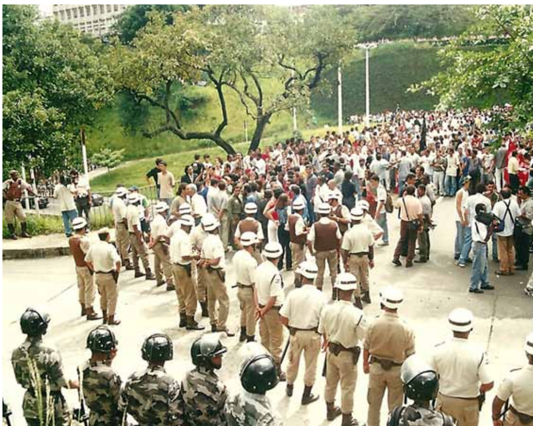
Os bancários protestaram junto com os estudantes contra ACM e a polícia radicalizou.