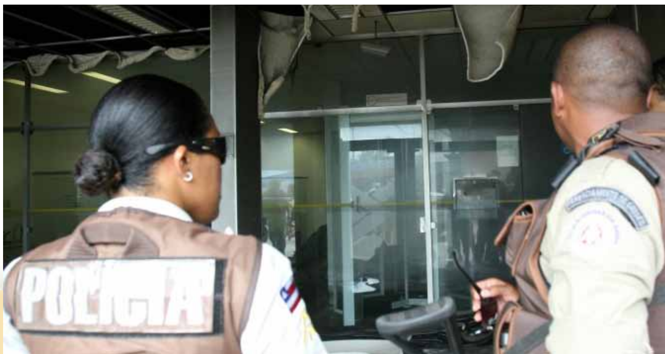
Enfim, o governo cria força sugerida pelo Sindicato.

- O que adianta proibir de atender um celular numa agência? Tem gente que acha que implementando a pena de morte irá se resolver a questão do marginal. Mas, os verdadeiros marginais são intocáveis, circulam livremente na sociedade.