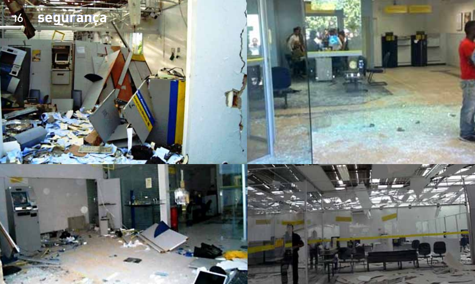
Quem mais sofre é a população do interior, sem policiais e sem equipamentos de segurança.