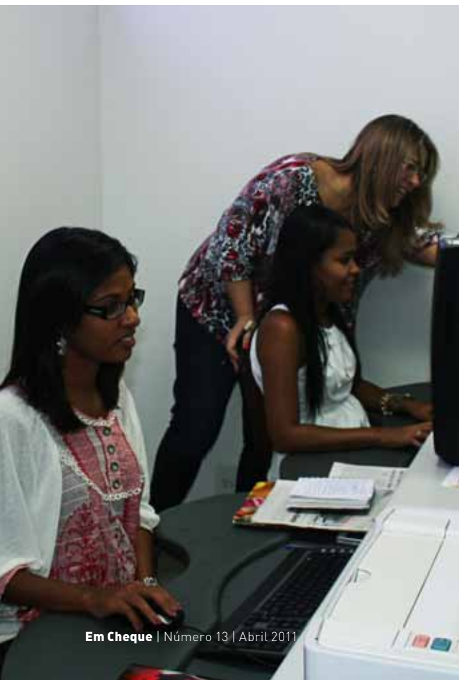
Rose e equipe: atentas a tudo, o tempo todo.

- Agilidade, competência e ética formam a base do jornalismo que se transformou num patrimônio de credibilidade con-