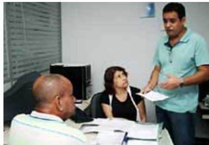
Defesa firme vence patrões poderosos.