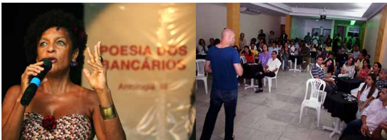
A poetisa Elisa Lucinda declama e os novatos também. Aqui há espaço para todos.

As atividades se multiplicam no Espaço Cultural Raul Seixas. Música, teatro, dança, literatura, artes plásticas e oficinas são produzidas, apoiadas e estimuladas pelo Sindicato. Aqui, as manifestações culturais de toda a comunidade têm vez e voz.