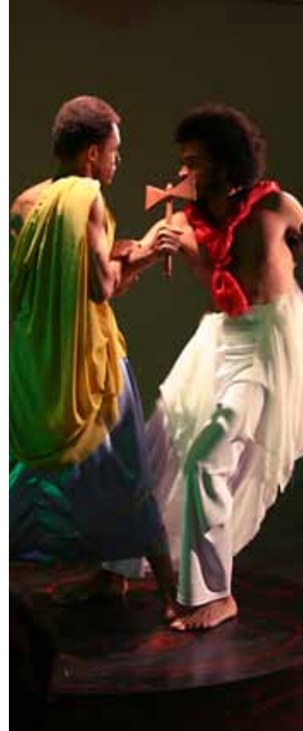
A dança tem público certo.

Em seu terceiro ano, a oficina de teatro é a mais procurada pelos bancários associados: "Eu descubro as habilidades através de dinâmicas de grupo e do autoconhecimento. O foco é descobrir a identidade de cada participante dentro da coletividade. Trabalhamos postura, expressão vocal, apreciação estética e o conceitos teóricos do