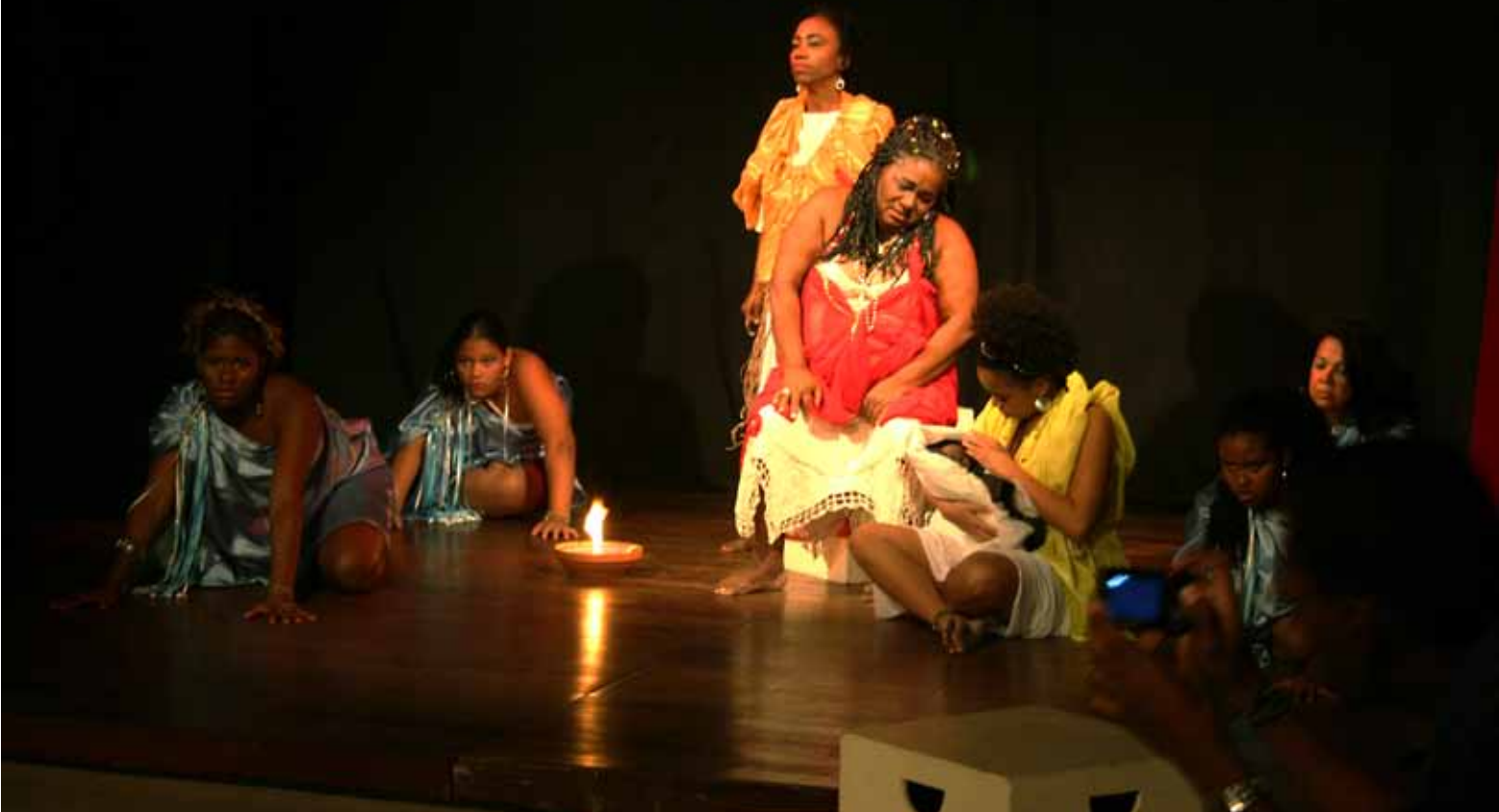
O teatro apresenta peças de grupos amador e profissional.

bancárias de Salvador de um de seus mais famosos e emblemáticos poemas, Aviso da Lua que Menstrua, e foi um sucesso, “os bancários aplaudiram muito e daí, render uma homenagem a uma mulher especial numa antologia foi um pulo. Ter a presença dessa atriz, negra, e poeta consagrou uma ação que já vinha sendo realizada pelo Sindicato”, destaca a diretora.