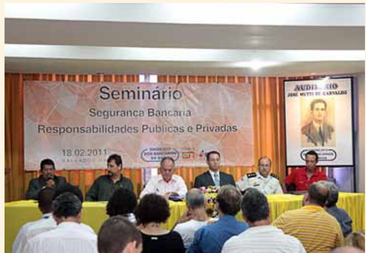
Seminário promovido pelo Sindicato veio em boa hora.

Tanto a área de saúde, quanto a segurança são os assuntos que o sindicato prioriza, diz ele, “para que exista uma solução que melhore a vida do bancário no interior”.