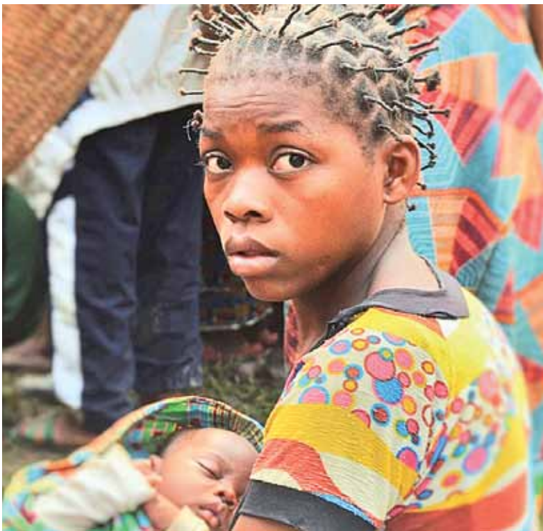
Em todo o mundo, 42% das mulheres não conseguem arranjar emprego