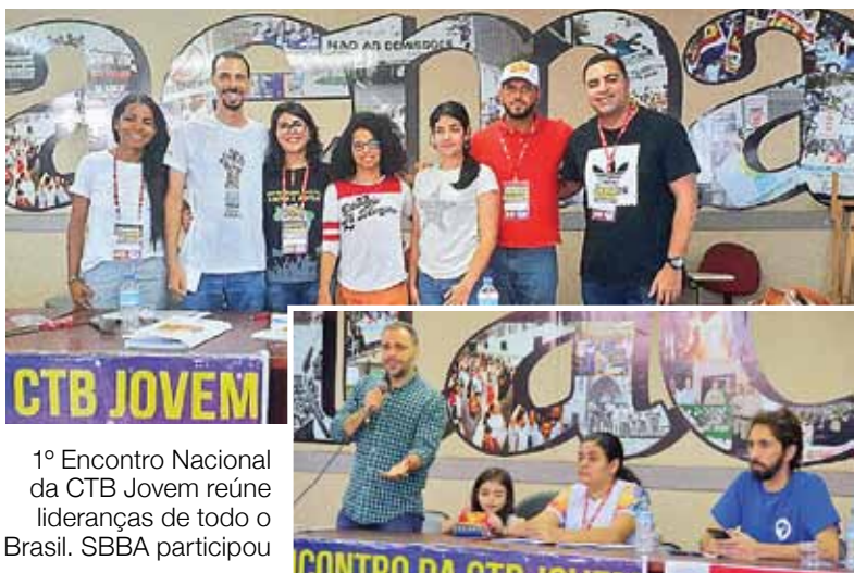
1º Encontro Nacional da CTB Jovem reúne lideranças de todo o Brasil. SBBA participou

A decisão do STJ foi baseada na divergência existente no artigo 3º da Lei nº 9.876/1999, que criou regra de transição limitando o período contributivo aos salários posteriores a julho de 1994. Enquanto que na regra geral, prevista no artigo 29, I e II da Lei nº 8.213/1991, considerava todo período contributivo para o cálculo da aposentadoria.