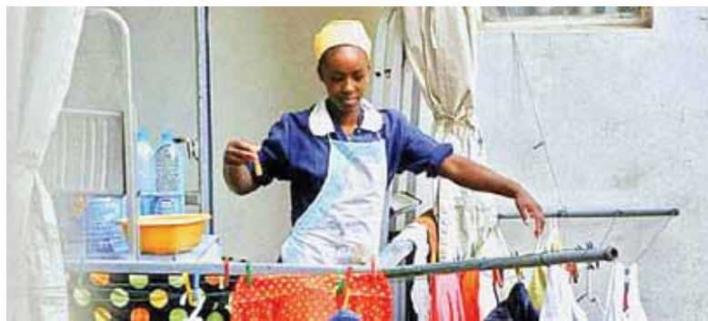
Faixa etária das trabalhadoras domésticas é entre 30 e 50 anos de idade

DADOS do Ipea (Instituto de Pesquisa Econômicas Aplicadas) mostram que até 2018 o trabalho doméstico era feito por 6,2 milhões de pessoas. O levantamento apontou que 92% (5,7 milhões) dos que realizavam o serviço eram mulheres.