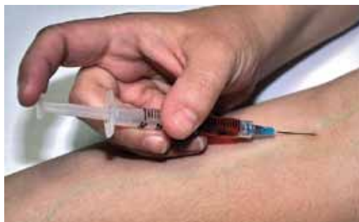
Compartilhar seringa: uma forma de contágio

O centro está localizado na rua 21 de setembro, nº 540, Santa Regina. Informações, basta entrar em contato com o número (77) 99126-5547.