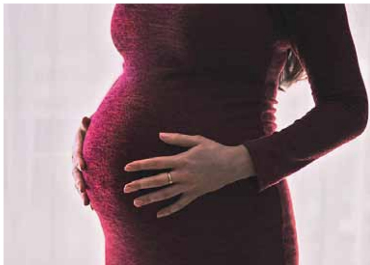
Grávidas em emprego temporário não têm mais direito à estabilidade

inciso II, do ADCT (Ato das Disposições Constitucionais Transitórias). A decisão foi tomada pelo TST (Tribunal Superior do Trabalho).