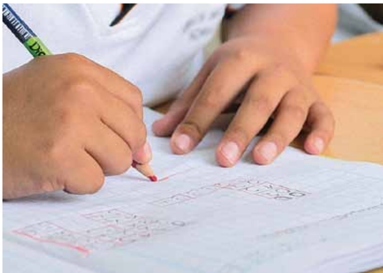
Sem recursos, qualidade da educação fica mais precária. Jovens perdem

A média obtida pelo Brasil é de 413 pontos em leitura, 384 pontos em matemática e 404 pontos em ciências. Os resultados são discrepantes quando comparados aos países ricos. É o caso de Canadá e Japão que obtiveram 487 pontos em leitura e 489 em matemática e ciências. O vizinho Chile também foi destaque.