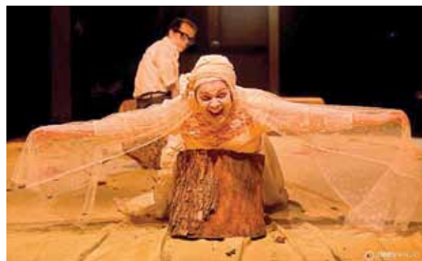
Hoje, às 19h, tem espetáculo no teatro Raul Seixas

de conferir o espetáculo, que faz parte do grupo residente do teatro Raul Seixas, localizado na sede do Sindicato dos Bancários da Bahia, na avenida Sete de Setembro, Mercês. Uma oportunidade de reflexão e entretenimento, localizada no centro da resistência da cidade.