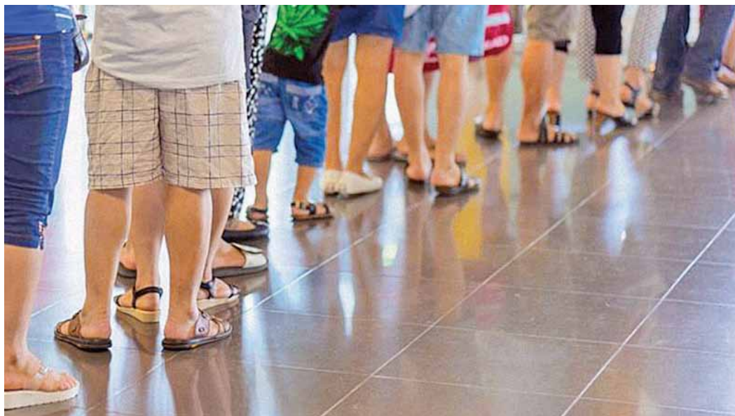
Com quadro de funcionários enxuto, clientes esperam muito mais do que 15 minutos nas agências

O BB, também localizado na avenida Sete de Setembro, foi autuado porque as senhas de controle de atendimento disponibilizadas na agência não possuíam o