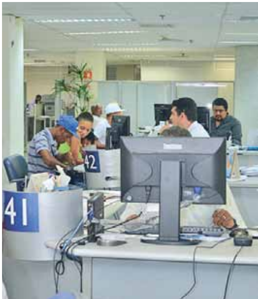
Anseios dos bancários serão colocados na mesa