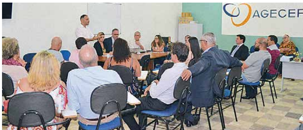
Gestores da Caixa participam de reunião na AGECEF. Situação do banco pede intensa mobilização