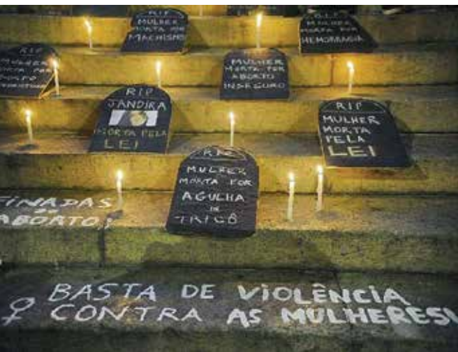
Nos dois últimos anos, foram registrados 2.357 mortes

Sobre os casos de lesão corporal dolosa relacionados à violência doméstica, o anuário aponta avanço de 2017 para 2018, passando de 252.895 registros para 263.067. No total, 88,8% das ocorrências são cometidas por parceiros ou ex-companheiros.