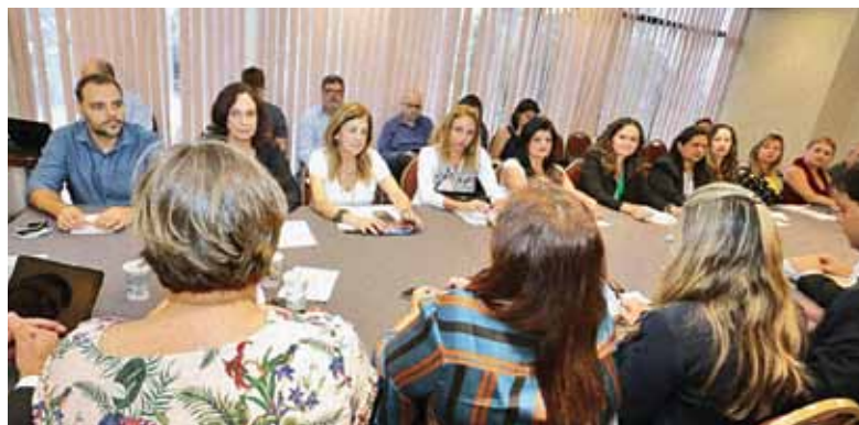
Em reunião, Comando e Fenaban tratam sobre novo caráter do censo