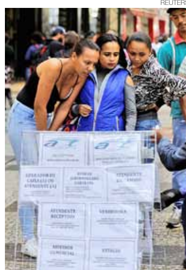
Mulher: preconceitos do mercado

de seis anos são ocupados por mulheres. Se não tiverem filhos a proporção sobe para 31%. Com Bolsonaro, a possibilidade de enfrentar a situação de desigualdade de gênero no país ficou mais difícil.