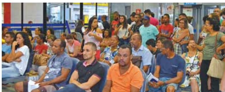
Na Caixa, cada vez mais longas filas com sobrecarga nos empregados

Os representantes dos funcionários destacam ainda a necessidade de intensificar os debates para que se chegue a uma proposta coerente com a realidade dos associados.