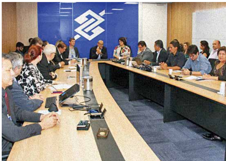
Na Cassi, os representantes dos funcionários cobram mais autonomia

Não é só isso. Os adoecimentos também tendem a aumentar. Nos últimos 12 anos, um em cada três bancários afirmam ter apresentado problema de saúde em decorrência do trabalho. Estresse e outras doenças psicológicas representam 60,5% dos casos. Preocupante.