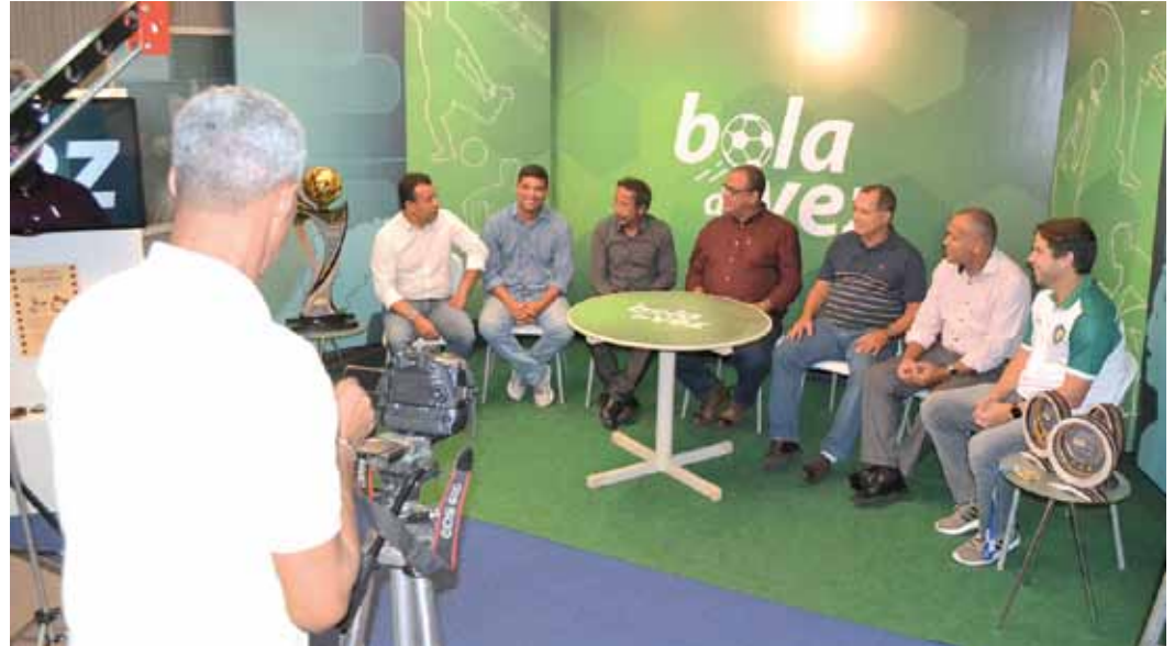
O programa Bola da Vez debate as atividades esportivas promovidas pelo Sindicato dos Bancários

ainda mais interessante a conversa. Pode ser conferido no Youtube , no site do Sindicato, além das redes sociais. Dá para assistir em qualquer lugar.