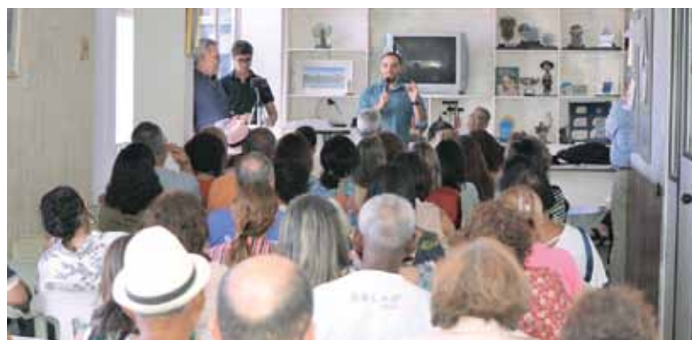
Assembleia da AEA lotada para discutir ação judicial contra a CGPAR 23

O Sindicato e demais entidades representativas ingressaram, em setembro, com representação no Ministério Público do Trabalho, questionando a constitucionalidade da resolução. A representação está com