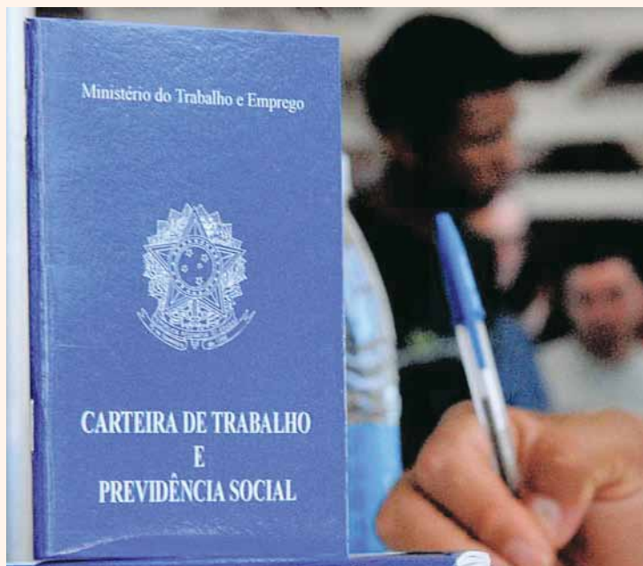
Trabalho com carteira assinada é cada vez mais escasso no Brasil

Por fim, disse que e havendo clima vai fazer a proposta e extinguir a Justiça do Trabalho. Quer dizer, se a situação já está ruim, certamente vai piorar daqui para frente com a negação do direito do trabalhador.